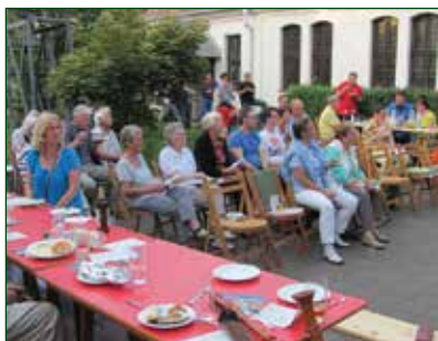
Zuhörer beim Hoffest im Gemeindezentrum