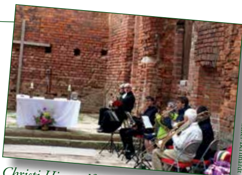
Christi Himmelfahrt – Gottesdienst mit dem Posaunenchor an der Fahrradkirche