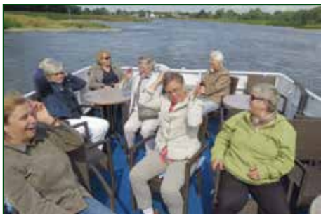
Bootsfahrt auf der Elbe – die Damen richten sich zum Fototermin

Nein, die 38 Teilnehmer der Busausfahrt in die Lutherstadt erlebten am 8. Juli dankbar einen Tag auf Luthers Spuren. Er folgte nicht nur ausgefahrenen Gleisen, sondern brachte spezielle Sichten auf die Welthauptstadt der Reformation hervor: eine Schifffahrt auf der Elbe mit dem Panorama der Stadt und einer Einführung in ihre Geschichte, eine Führung im Lutherhaus durch die Sonderausstellung seines berühmten Freundes, des Reformators mit dem Pinsel, Lucas Cranach, eine Besichtigung der renovierten Stadtkirche, Luthers Hauptpredigtstätte, auf deren Kanzel sogar schon Markkleeberger Konfirmanden gepredigt haben, und einen Blick auf den Luthergarten, in dem Kirchenprominenz aus aller Welt inzwischen fast 500 Bäume gestiftet und gepflanzt hat. Natürlich gab es auch gut zu