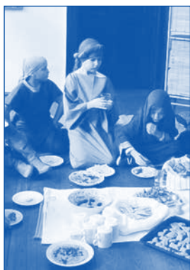
Gemeinsames Essen nach kreativer Kinderkirche

Ob „Brot aus der Wüste“, „Salomos Hühnchenkebab“ oder „Judas Mandelkrokant“ - zur Kinderkirche Kreativ am 28. März wurde von 10 Kindern fleißig geschnippelt, gekocht, gebacken und genascht. Am Ende wurden die süßen, herzhaften, bekannten und unbekanntenen Speisen von den Kindern in biblischen Kostümen und von den Mitarbeitern „zu Tische liegend“ verzehrt. Es war ein schöner Vormittag, der viel Spaß gemacht hat und bei dem allen (fast) alles geschmeckt hat.