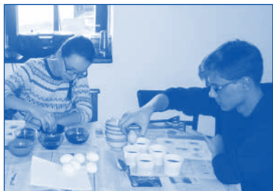
Helfer des Osterhasens beim Ostereierfärben

Seit Jahrzehnten ist die liturgische Ostermette am Ostersonntag um 6 Uhr, beginnend mit dem Osterfeuer im Park, gefolgt vom Einzug in die nur von Kerzen erhellte Kirche ein gottesdienstlicher Höhepunkt. Über 100 Besucher waren der Einladung der Kirche, „am Ende dieser hochheiligen Nacht zu wachen und zu beten“, gefolgt. Danach war wieder das Osterfrühstück für die Gemeinde im Alten Kantorat liebevoll vorbereitet – mit phantasievoll gefärbten Eiern, kreativ gefalteten Servietten, noch warmen Brötchen, Bärlauch-