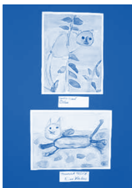
Ausstellung „Tiere der Arche Noah“ im Pfarrhaus Großstädteln