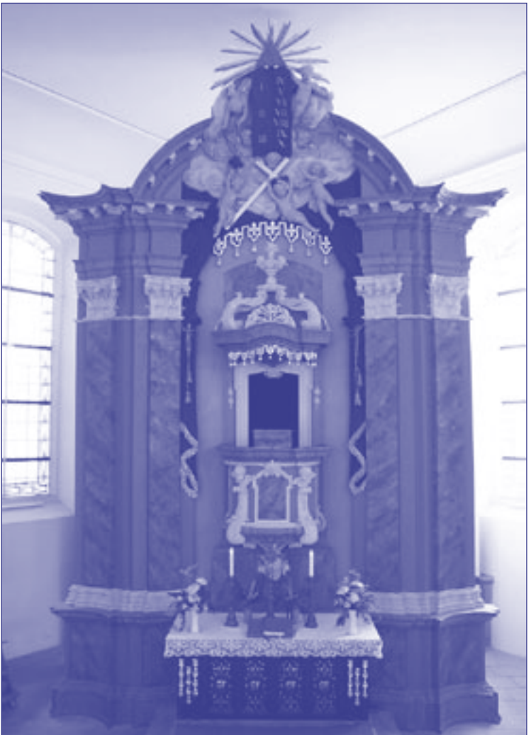
Altar der Martin-Luther-Kirche