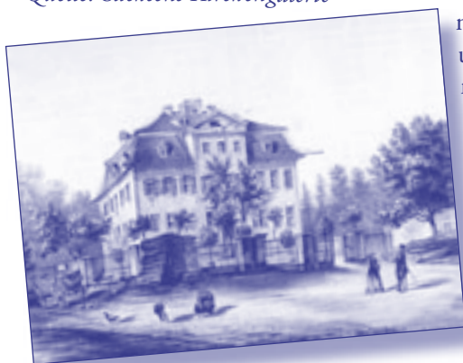
Herrenhaus des Rittergutes Zehmen um 1860

seiner Kirche, seines Herrenhauses und seines Umlandes oder historische Fotos, Filmmaterial, alte Urkunden, Tagebücher oder andere Zeitdokumente? Wir möchten Sie herzlich einladen, uns Ihre Erinnerungsstücke zu zeigen und die Geschichten zu erzählen, die Sie mit Zehmen verbinden. Wir treffen uns mit Ihnen am Sonnabend, dem 16. Juni, von 14.00 - 16.00 Uhr in der Katharinenkirche Großdeuben, wo der alte Zehmener Altar seine neue Heimat gefunden hat.