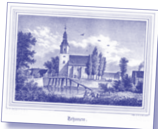
Die Kirche von Zehmen um 1840