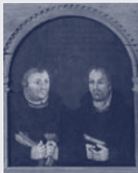
Doppelporträt der Reformatoren Martin Luther und Philipp Melanchthon (1497-1560). - Ausschnitt aus einer Kan- zeltür, Hameln, um 1560