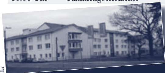
Autorin: Heike Müller