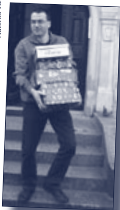
Abtransport der Päckchen

... den Hintergrundarbeiterinnen beim Weihnachtso- ratorium die die Verpflegung von Chor, Orchester und Solisten sicherstellten sowie den Eintrittskarten- und den Programmverkauf absicherten.