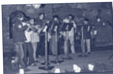
Autorin: Heike Müller

dem Hausbibelkreis, der die inhaltliche Arbeit und organisatorische Durchführung leistete sowie dem Posaunenchor für die musikalische Ausgestaltung