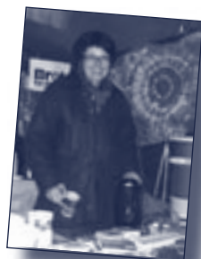
Autorin: Renate Strohmann

Strohmann. Es konnten von unserer Gemeinde 265,98 € an die Diakonie und vom Kirchenbezirk 1.376,06 € an „Brot für die Welt“ überwiesen werden.