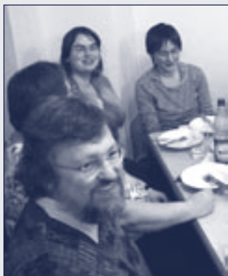
Autor: Werner Stroka