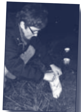
Autor: Renate Strömann