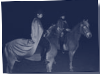
Beim Martinsfeuer am See