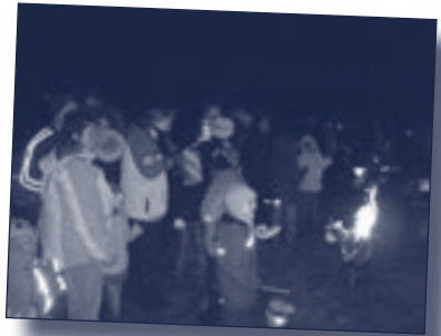
Autor: Katja Oelmann