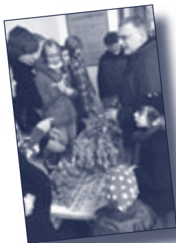
Die Plätzchenbäcker beim Verkauf

aus der Jungen Gemeinde. Beim Verkauf von selbst gefertigten Plätzchen nach den Gottesdiensten am 1. und 2. Advent konnte ein Erlös von 210,- € für das Jugenddankopfer erzielt werden.