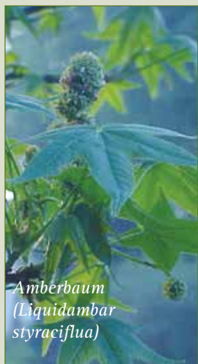
Amberbaum (Liquidambar styraciflua)

„Wie findet man Geschichte(n) zur Kirche?“