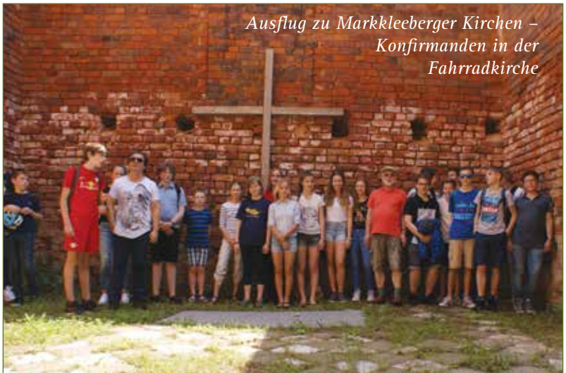
Ausflug zu Markkleeberger Kirchen – Konfirmanden in der Fahrradkirche